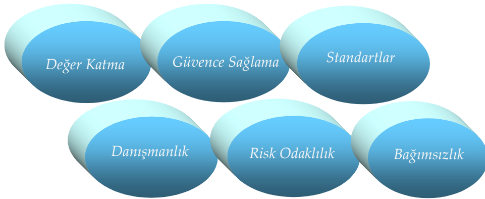
Şekil – 3. İç Denetimin Temel Unsurları

Örgüte katılan değer, sağlanan güvence, verilen danışmanlık hizmeti, evrensel standartlara uygunluk, kurumsal bağımsızlık, risk odaklı denetim ve meslek ahlâk kuralları iç denetiminin temel unsurlarını oluşturur.