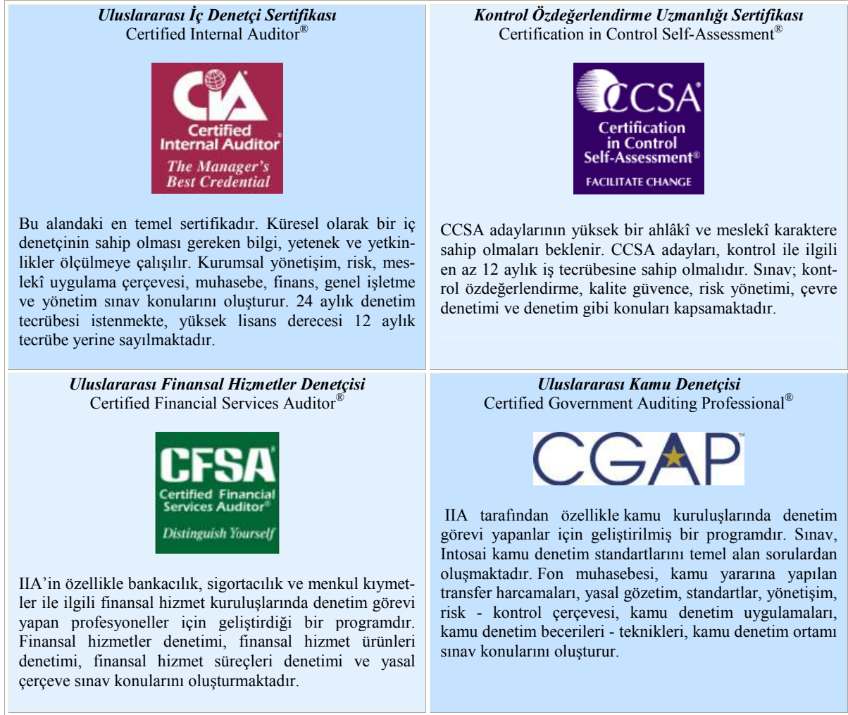
Şekil – 5. İç Denetimde Uluslararası Unvan sertifikaları.

İç denetçilerin meslekî gelişimleri maksadıyla, İç Denetçiler Enstitüsü IIA’in verdiği ve uluslararası geçerliliği bulunan dört "unvan sertifikası" 38 bulunmaktadır.